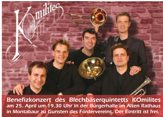
Benefizkonzert des Blechbäserquintetts KOMILITES am 25. April um 19.30 Uhr in der Bürgerhalle im Alten Rathaus in Montabaur zu Gunsten des Fördervereins. Der Eintritt ist frei.

Krankenhaus der Barmherzigen Brüder Montabaur Koblenzer Straße 11 - 13 · 56410 Montabaur Tel. (02602) 122 - 0 · Fax (02602) 122 - 709 www.bk-montabaur.de · info@bk-montabaur.de