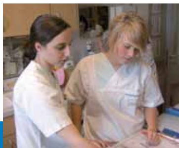
Praxisanleiterin und Schülerin

Die dreijährige Ausbildung ist anspruchsvoll und deckt ein vielfältiges